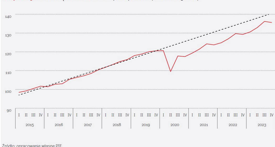
Wykres 15. PKB – bieżąca wielkość i trend sprzed pandemii (średnia 2015 = 100)