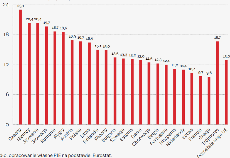
Wykres 3. Udział produkcji przemysłowej w generowaniu wartości dodanej do PKB w 2018 r. (w proc.)