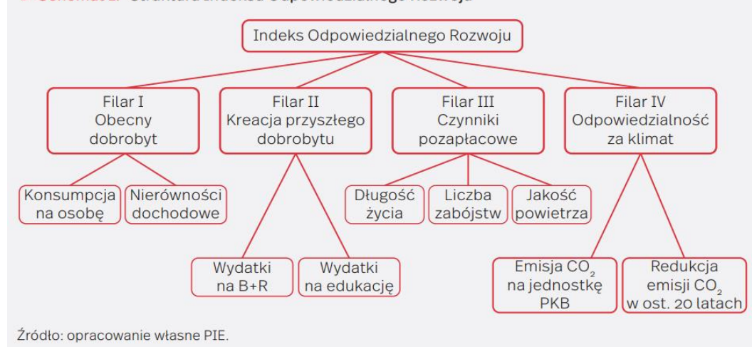
▼ Schemat 1. Struktura Indeksu Odpowiedzialnego Rozwoju

Pierwsza edycja Indeksu Odpowiedzialnego Rozwoju została opublikowana w 2019 r. i składała się z trzech filarów, na które składało się osiem wskaźników. W tegorocznej edycji rozszerzyliśmy Indeks o czwarty filar związany z odpowiedzialnością za klimat.