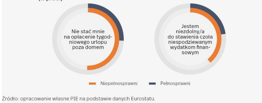
Wykres 6. Problemy finansowe osób (nie)pełnosprawnych mieszkających w Polsce w 2020 r. (w proc.)