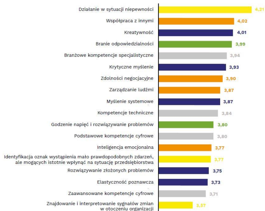
Wykres 6. Średnia ocen znaczenia danej kompetencji w przyszłości (w skali od 1 do 5)

Uwaga: kolor niebieski oznacza kompetencje poznawcze, pomarańczowy – społeczne, szary – cyfrowe i specjalistyczne, zielony – transformatywne, żółty – adaptacyjne.