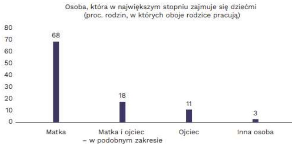
Wykres 16. Nawet gdy oboje rodzice pracują, to głównie matki zajmują się dziećmi