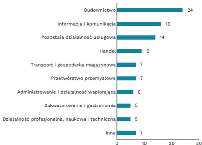
Wykres 5. Nowo powstałe ukraińskie jednoosobowe działalności gospodarcze w Polsce w okresie styczeń-wrzesień 2022 r. wg branż (w proc.)