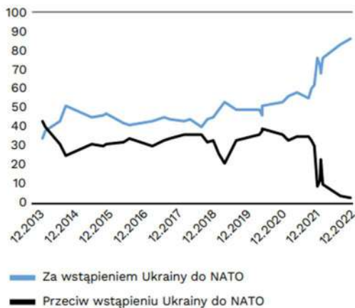
Wykres 8. Poparcie w społeczeństwie ukraińskim dla członkostwa Ukrainy w NATO (w proc.)