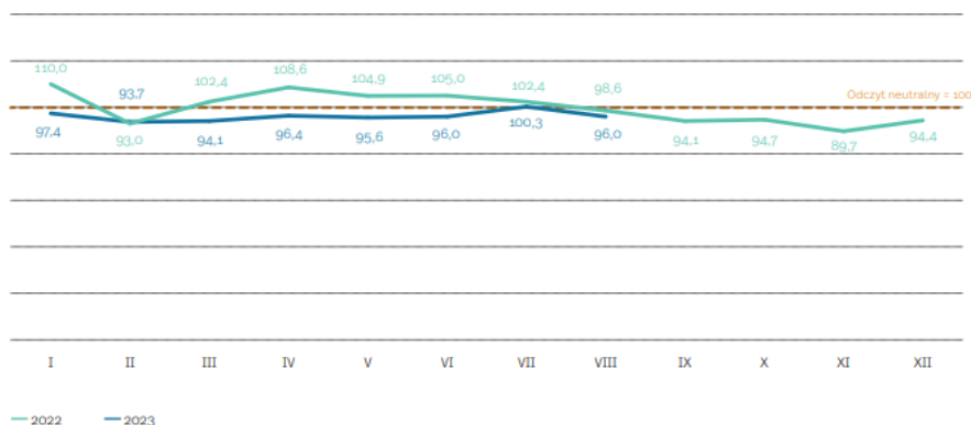
MIK zestawienie comiesięczne

Odczyty poniżej wartości neutralnej dotyczą liczby nowych zamówień (81,0 pkt.; spadek o 11,7 pkt. m/m), wartości sprzedaży (84,1 pkt.; spadek o 7,5 pkt. m/m), wskaźnika inwestycji (76,3 pkt., spadek o 10,5 pkt. m/m), a także mocy produkcyjnych (94,3 pkt.). Zwraca uwagę odczyt nieco poniżej poziomu neutralnego komponentu dotyczącego zatrudnienia (99,5 pkt.), który przez sześć poprzednich miesięcy utrzymał się powyżej