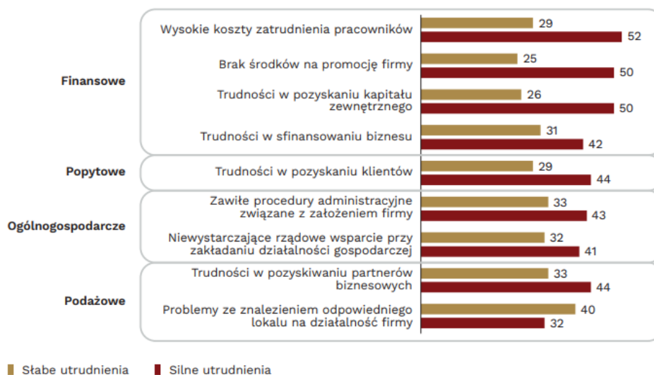
Wykres 10. Silne i słabe utrudnienia przy zakładaniu własnej działalności gospodarczej w ocenie osób, które po pięćdziesiątce założyły firmę (w proc.)